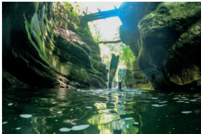
Les gorges de l'Areuse, un terrain de jeux pour les apnéistes, tous des nageurs confirmés, qui explorent deux à trois fois par an la zone se situant sous le pont des Clés.