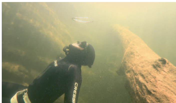
Sous l'eau, des troncs entremêlés, un «mikado» grandeur nature où il fait bon «buller».