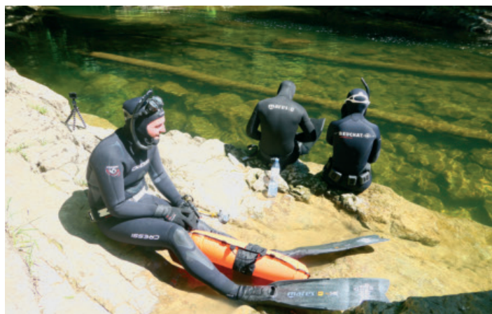
Après une préparation sur la berge, le plongeon est imminent.

Les amis se mettent à l'eau et la partie de plaisir peut commencer dans la zone d'exploration d'une longueur de 100